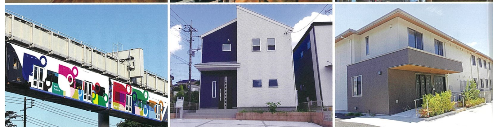
医療・福祉業界から日本が「もう一度世界をリードする」を胸に、首都圏を中心にグループ企業9社、160以上の事業所を運営中。2023年に一新したコーポレートアイデンティティのリニューアルでは、千葉都市モノレールのラッピング広告等を展開。国際デザインコンペ「A'Design Award」金賞を受賞している。

それは生命に関わる社会課題の解決ではないのか。大学時代に学んだ2025年問題に向き合おうと決断しました」